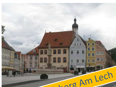
Landsberg Am Lech

Dopo aver attraversato il ponte sul fiume e la Bayertor (XV secolo), il centro appare subito in tutta la sua bellezza: la Hauptplatz, (la piazza principale), ospita il Rathaus (antico municipio), caratterizzato da una facciata decorata con pregevoli stucchi, la fontana Mariebrunnen, e la Schmalzturm del tredicesimo secolo, una splendida torre con orologio integrata nella cinta muraria