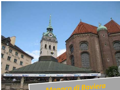
Monaco di Baviera

Da segnalare, per i più sportivi (non è stato il nostro caso), la possibilità di salire in cima al campanile. Sicuramente la faticosa salita di 300 scalini, verrà premiata con una splendida vista sulla città.