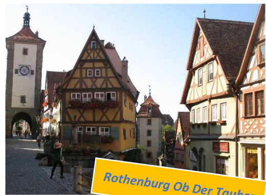
Rothenburg Ob Der Tauber

Degne di interesse sono anche le numerosi torri presenti: la Kohlturn a pianta quadrata, la Johanniterturm , a pianta rotonda situata vicino alla Johanniskirche , chiesa del convento giovanita originaria del 1400, la Spitalbastei , baluardo del 1430 presso il complesso ospedaliero del XVI secolo con cortile centrale circondata da diversi edifici, tra cui lo Ochsenbau del 1554. Quest'ultimo fu ricostruito nel 1921 in seguito ad un incendio ed adibito ad ostello per la gioventù. Altrettanto interessanti sono le chiese: quella di St. Jakob , in stile gotico del XIV secolo, la Frankiskanerkirche , antica chiesa francescana che risale al 1285, e la chiesa romanica di Derwang .