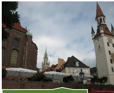
Monaco di Baviera

Ci allontaniamo di poco da questa splendida piazza per andare a visitare il Viktualienmarkt , che è il più famoso mercato di Monaco, in funzione da oltre due secoli, ed è uno dei pochi mercati della città ad essere aperto dal Lunedì al Sabato. Durante la seconda guerra mondiale ci furono molti bombardamenti su Monaco e anche l'area del mercato subì notevoli danni ma già negli anni '50 il Viktualienmarkt tornò a rifiorire e venne arricchito di piccole e graziose fontane sparse qua e là tra i diversi banchi a ricordo di alcuni tra i più amati esponenti del cinema e del teatro popolare bavarese. Oggi il Viktualienmarkt non si presenta come un comune mercato rionale ma come una sorta di grande negozio all'aperto, con banchi ordinati, tutti rigorosamente di colore verde scuro; l'area su cui si estende il mercato è di 22.000 m 2 mentre il numero dei negozianti presenti è 140. Per chiudere in bellezza la visita consiglio vivamente una sosta nel grande Biergarten, il caratteristico giardino della birra ai piedi del Maibaum, il colorato albero del 1 maggio.