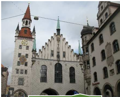
Monaco di Baviera

Sul lato opposto della piazza si trova il Vecchio Municipio costruito tra il 1470 ed il 1480. Come molti altri monumenti di questa città fu in gran parte distrutto durante la II Guerra Mondiale. La sala del municipio è caratterizzata da una volta in legno a botte, esempio del tardo gotico bavarese. Qui un tempo erano custodite 10 figure in legno, risalenti al 1480, opera di Erasmo. Tali opere sono attualmente esposte al Museo Cittadino di Monaco. Nella Torre del municipio, ricostruita nel 1975, si trova un Museo dei Giocattoli.