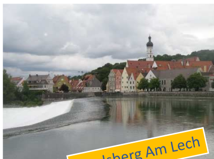
Landsberg Am Lech

Appagati di questa bella visita raggiungiamo nuovamente il camper (questa volta a piedi!!) e partiamo alla volta di LANDSBERG AM LECH Ci sistemiamo agevolmente in un parcheggio gratuito molto vicino al centro (Penso utilizzabile anche per un eventuale sosta notturna) e partiamo alla scoperta di questa pittoresca cittadina sulle rive del fiume Lech, all'incrocio tra la Via Claudia e l'antica Via del Sale.