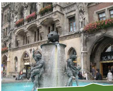
Monaco di Baviera

Appena usciti dalla metropolitana veniamo subito rapiti dalla magnificenza del Nuovo Municipio ( Neues Rathaus ) la cui costruzione fu ordinata da Re Ludwig I. La Torre, alta 85m, costituisce il punto centrale della costruzione neogotica ed in essa è incastonato il famoso Glockenspiel , una sorta di carillon basato sul suono di campane. La facciata del Nuovo Municipio, lunga quasi 100m, è adornata di figure e ornamenti di duchi, principi e re bavaresi, di allegorie, figure leggendarie e santi. I cortili interni, invece, sono costruiti sull'esempio dei cortili medioevali.