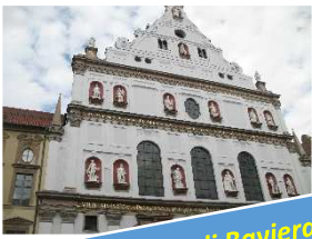
Monaco di Baviera

Terminata la visita riprendiamo la metropolitana e torniamo in centro, dove troviamo un simpatico locale sul retro della chiesa di St. Peter dove mangiare qualcosa. Proseguiamo poi la nostra passeggiata per le bellissime vie del centro, soffermandoci in particolare sulla bellissima chiesa rinascimentale di St. Michael