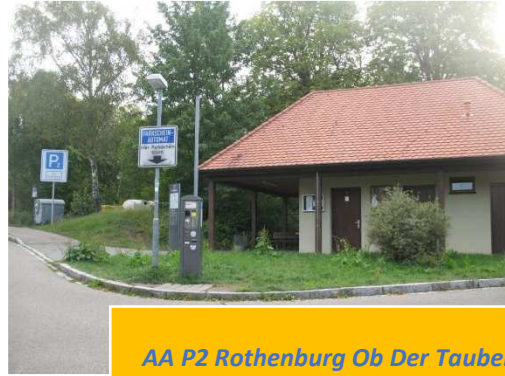
AA P2 Rothenburg Ob Der Tauber

Come dicevo l'area oltre ad essere molto comoda per la visita della città è anche molto ben servita da supermercati (LIDL) e negozi in genere. Ne approfittiamo subito per rimpinguare la cambusa e poi torniamo di corsa al camper visto che, stranamente, si è messo a piovere!. Dopo cena passeggiata con Marlin, letture varie e nanna.