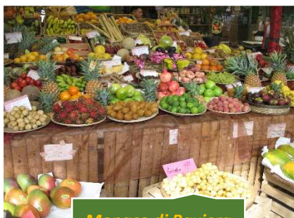
Monaco di Baviera

Ci allontaniamo di poco da questa splendida piazza per andare a visitare il Viktualienmarkt , che è il più famoso mercato di Monaco, in funzione da oltre due secoli, ed è uno dei pochi mercati della città ad essere aperto dal Lunedì al Sabato. Durante la seconda guerra mondiale ci furono molti bombardamenti su Monaco e anche l'area del mercato subì notevoli danni ma già negli anni '50 il Viktualienmarkt tornò a rifiorire e venne arricchito di piccole e graziose fontane sparse qua e là tra i diversi banchi a ricordo di alcuni tra i più amati esponenti del cinema e del teatro popolare bavarese. Oggi il Viktualienmarkt non si presenta come un comune mercato rionale ma come una sorta di grande negozio all'aperto, con banchi ordinati, tutti rigorosamente di colore verde scuro; l'area su cui si estende il mercato è di 22.000 m 2 mentre il numero dei negozianti presenti è 140. Per chiudere in bellezza la visita consiglio vivamente una sosta nel grande Biergarten, il caratteristico giardino della birra ai piedi del Maibaum, il colorato albero del 1 maggio.