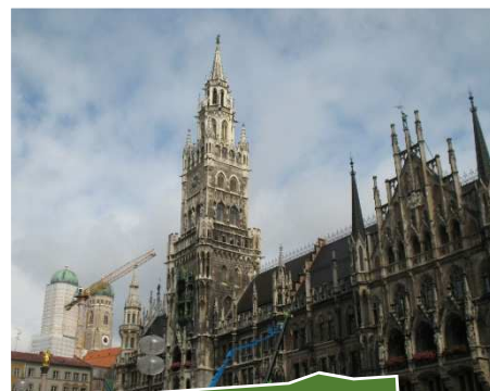
Monaco di Baviera

Appena usciti dalla metropolitana veniamo subito rapiti dalla magnificenza del Nuovo Municipio ( Neues Rathaus ) la cui costruzione fu ordinata da Re Ludwig I. La Torre, alta 85m, costituisce il punto centrale della costruzione neogotica ed in essa è incastonato il famoso Glockenspiel , una sorta di carillon basato sul suono di campane. La facciata del Nuovo Municipio, lunga quasi 100m, è adornata di figure e ornamenti di duchi, principi e re bavaresi, di allegorie, figure leggendarie e santi. I cortili interni, invece, sono costruiti sull'esempio dei cortili medioevali.