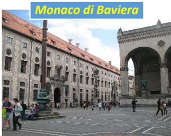
Monaco di Baviera

Non può mancare una visita alla famosa Residenz (anche se solo esternamente). Questo complesso di edifici fu costruito tra il XVI e il XIX secolo, e fa parte delle opere eccezionali del Rinascimento Europeo. Comprende sei cortili e si può suddividere in tre gruppi principali: l'edificio reale , con la fronte rivolta alla Max-Joseph Platz, la vecchia residenza che si affaccia sulla Residenzstrasse, e l'edificio del salone sulla Hofgartenstrasse. Anche questo complesso venne duramente danneggiato nel corso della guerra, ma quattro decenni di restauro e ricostruzione lo hanno riportato agli splendori di un tempo.