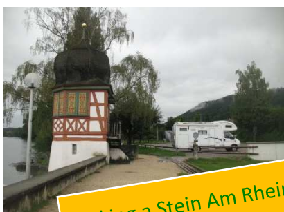
Parking a Stein Am Rhein

E' veramente bello passeggiare in mezzo a queste tradizionali case a graticcio le cui facciate sono delle vere e proprie opere d'arte sia per la loro forma che per gli affreschi. Siamo sorpresi da un acquazzone piuttosto violento e il sole e la temperatura di ieri sembrano solo un lontano ricordo.