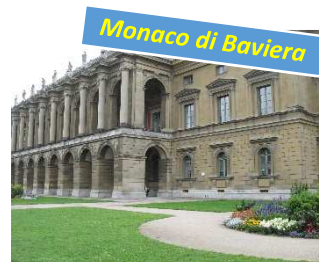
Monaco di Baviera