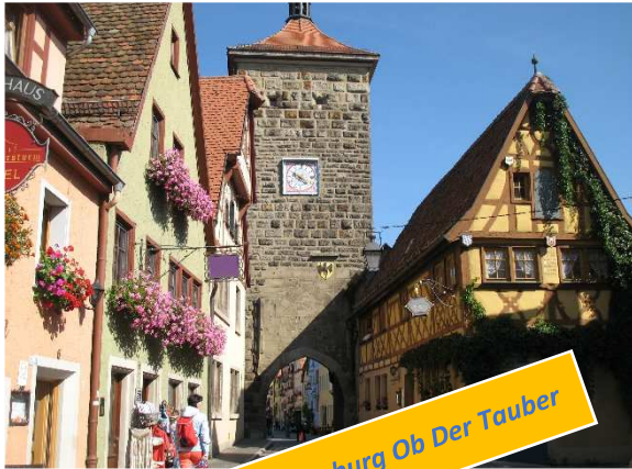
Rothenburg Ob Der Tauber