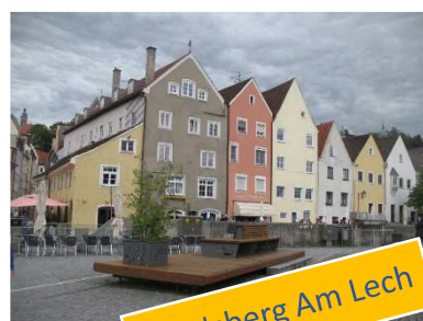
Landsberg Am Lech

Sulla piazza si affacciano numerosi edifici in stile rococò, ed è veramente piacevole passeggiare in questo coloratissimo contesto. Nel 1924 questa città conobbe un'improvvisa notorietà poiché nel carcere locale fu rinchiuso Adolf Hitler, condannato per un tentativo di colpo di Stato. E proprio durante la detenzione iniziò la stesura del "Mein Kampf". Ci fermiamo a mangiare un kebab in un locale lungo il corso principale e poi, tornati al camper, partiamo alla volta della nostra prossima meta, DONAUWORTH