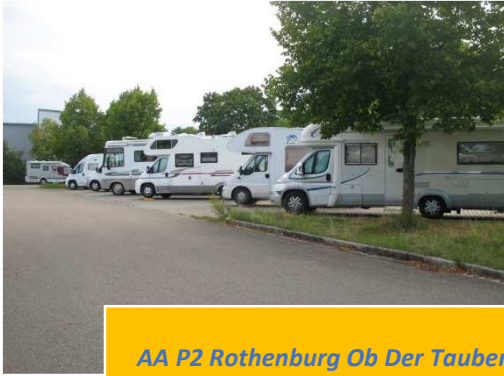
AA P2 Rothenburg Ob Der Tauber