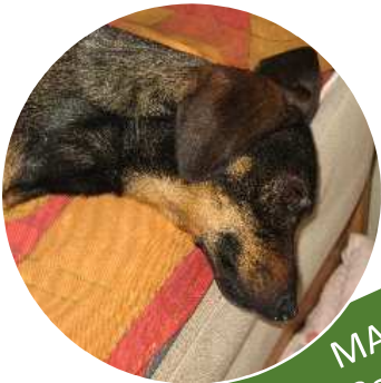
MARLIN Pseudo Bassotto di 2 anni