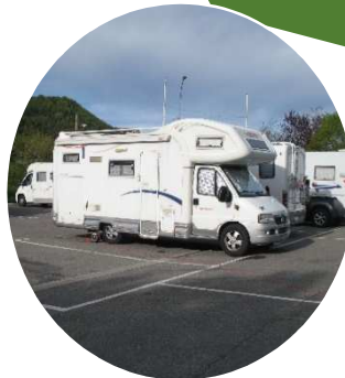
CI MIZAR Garage "RANOCCHIO"