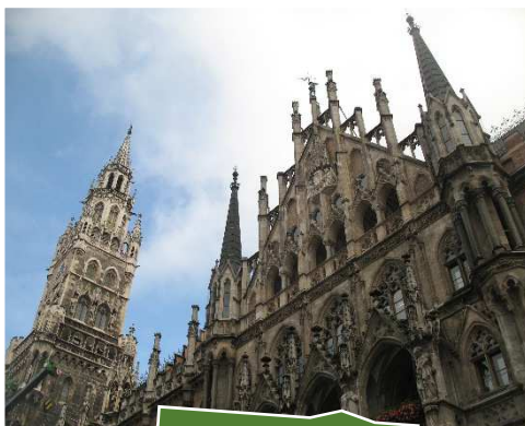
Monaco di Baviera

Nella notte, manco a dirlo, ha piovuto, ma comunque stamattina al nostro risveglio ci attende il sole. Dopo le solite operazioni mattutine ci prepariamo per andare alla scoperta di questa bella città. Come già detto in precedenza all'uscita del campeggio ci aspetta il bus che in pochi minuti ci porta alla fermata della metropolitana U3 e dopo poche fermate (3-4 non ricordo bene) scendiamo a Marienplatz il cuore del centro storico.