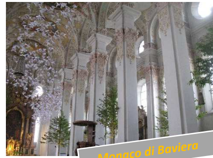
Monaco di Baviera

Prima di rientrare al campeggio decidiamo di visitare la Frauenkirche , la cattedrale di Monaco. La sua costruzione risale alla fine del 1400 ad opera dell'architetto Jörg von Halsbach. Ampia e solenne, con i suoi due campanili gemelli alti 99 metri e con la punta a forma di cipolla, è uno dei simboli della città. Appena varcato il portone d'ingresso, prima della cancellata che sancisce l'ingresso ufficiale nel Duomo, si trova sul pavimento l'impronta di un piede... la leggenda vuole che si tratti del piede del Diavolo! L'interno è a tre navate e ospita splendide vetrate: solo poche sono quelle originali (in particolare quelle intorno al presbiterio) dal momento che parecchie sono andate distrutte durante i bombardamenti della seconda guerra mondiale. All'inizio della navata destra si trova il mausoleo in marmo e bronzo dell'imperatore Ludwig IV il Bavaro (1282-1347), primo membro della famiglia Wittelsbach a diventare Kaiser del Sacro Romano Impero. Intorno all'altare maggiore è riportato l'elenco in ordine cronologico, con i rispettivi stemmi, di tutti gli arcivescovi di Monaco, tra i quali spicca Joseph Ratzinger, vescovo dal 1977 al 1982 e futuro Papa Benedetto XVI, mentre nella cripta (accesso dietro l'altare maggiore) si trovano le tombe di alcuni esponenti della famiglia Wittelsbach, tra cui quella di Ludwig III (1845-1921), ultimo re di Baviera e cugino del più celebre Ludwig II.